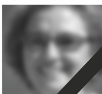
Petra wartet nicht mehr auf eine Leber