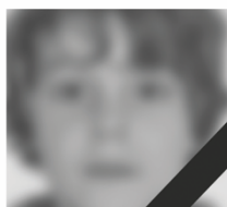
Merlin wartet nicht mehr auf ein Herz